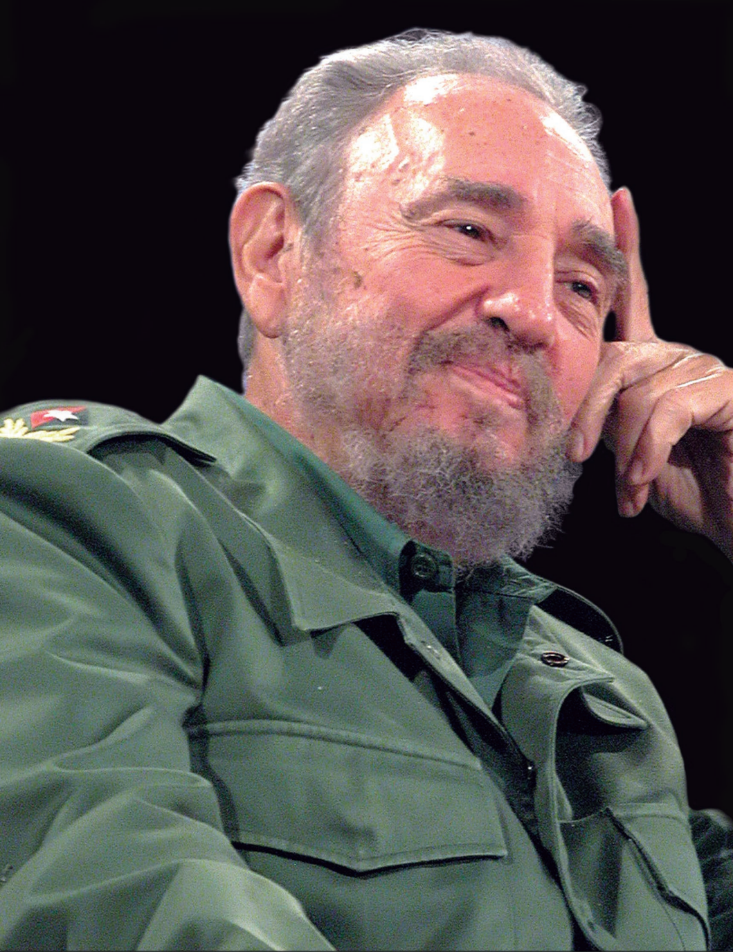
Fidel Castro Ruz (1926 - 2016)